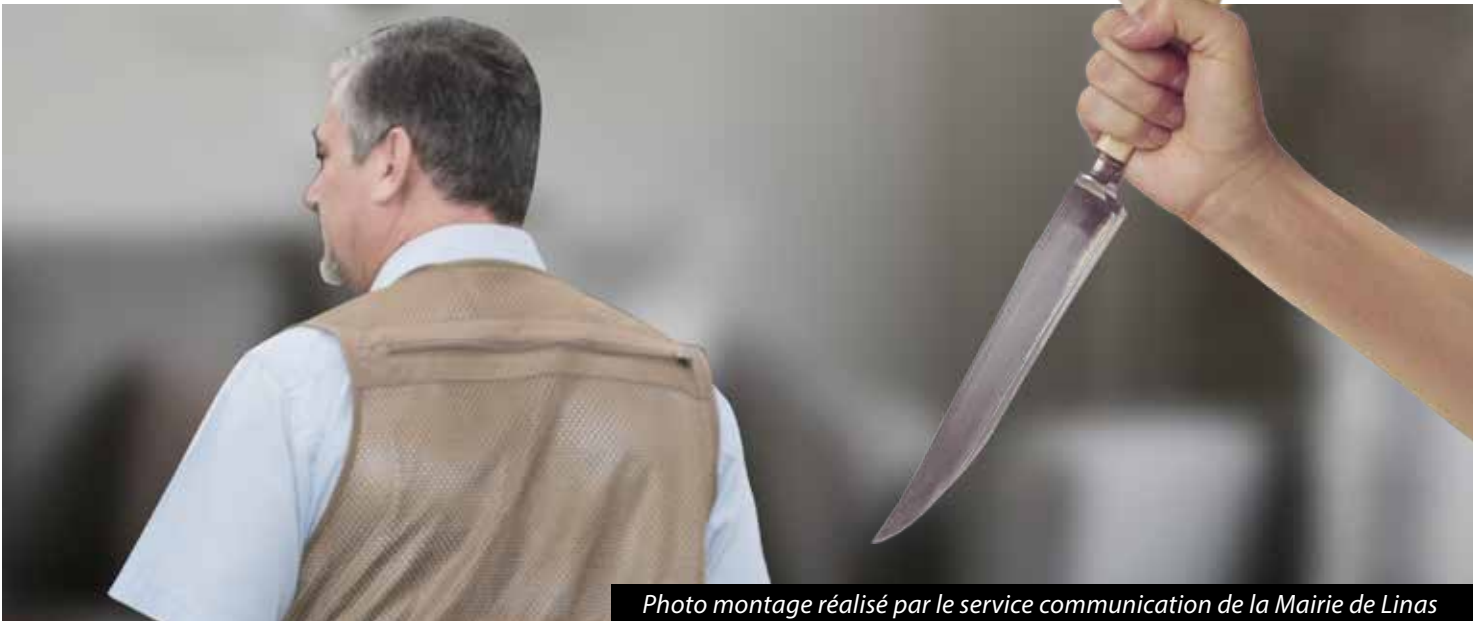
Photo montage réalisé par le service communication de la Mairie de Linas