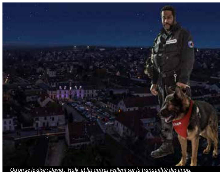
Qu'on se le dise : David, Hulk et les autres veillent sur la tranquillité des Linois.

Le 16 novembre, j'ai pu échanger avec le Directeur Départemental de la Sécurité Publique au sujet de la mise en place d'un réseau de citoyens vigilants à Linas. Avec la Commissaire d'Arpajon nous avons travaillé sur ce sujet lors d'une réunion le 23 novembre. Une convention va pouvoir être signée entre la commune et la Police Nationale afin d'identifier des habitants anonymes chargés de surveiller leur rue ou leur quartier. Ils seront les yeux de la Police. Vous avez été plusieurs à vous signaler suite à mon appel dans le Linas Actualités n°288 afin de faire partie de ce réseau des citoyens vigilants.