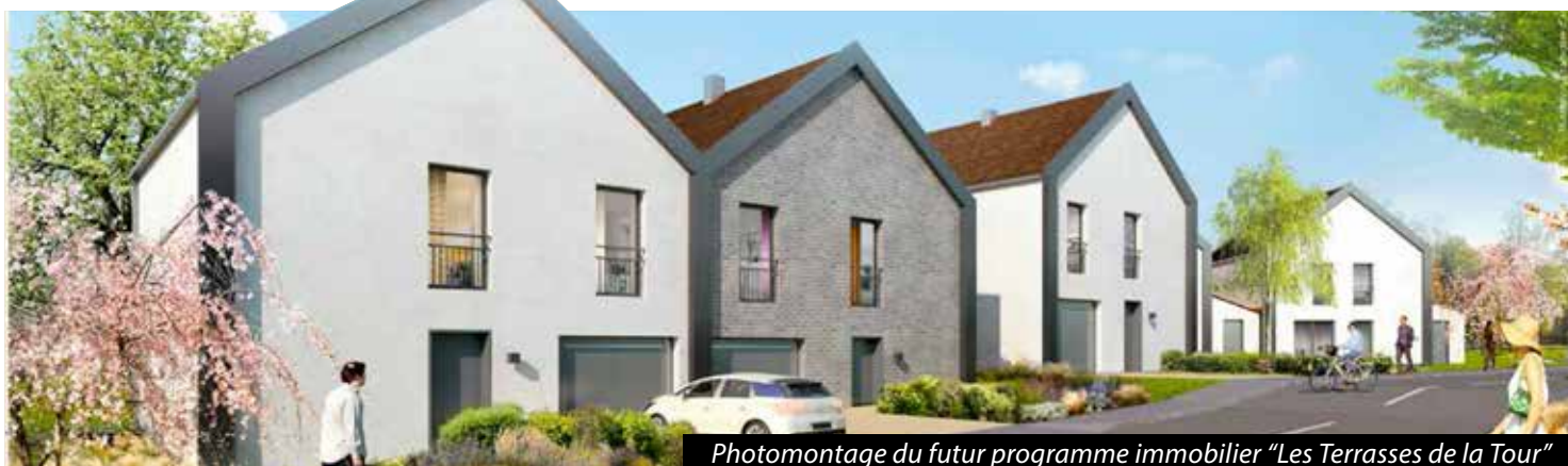
Photomontage du futur programme immobilier "Les Terrasses de la Tour"